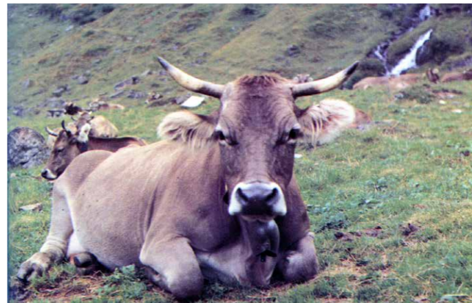
Una mucca placida in Valle Antigorio prima della béisa .