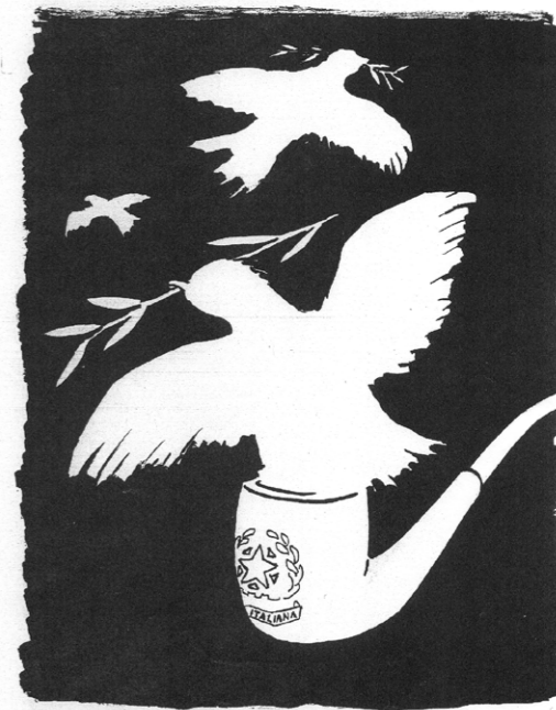
OMAGGIO al PRESIDENTE " SANDRO PERTINI, "

e satirica della nostra storia recente. Il disegno di copertina reca una pipa, simbolo di pacata riflessione, da cui escono colombe bianche.